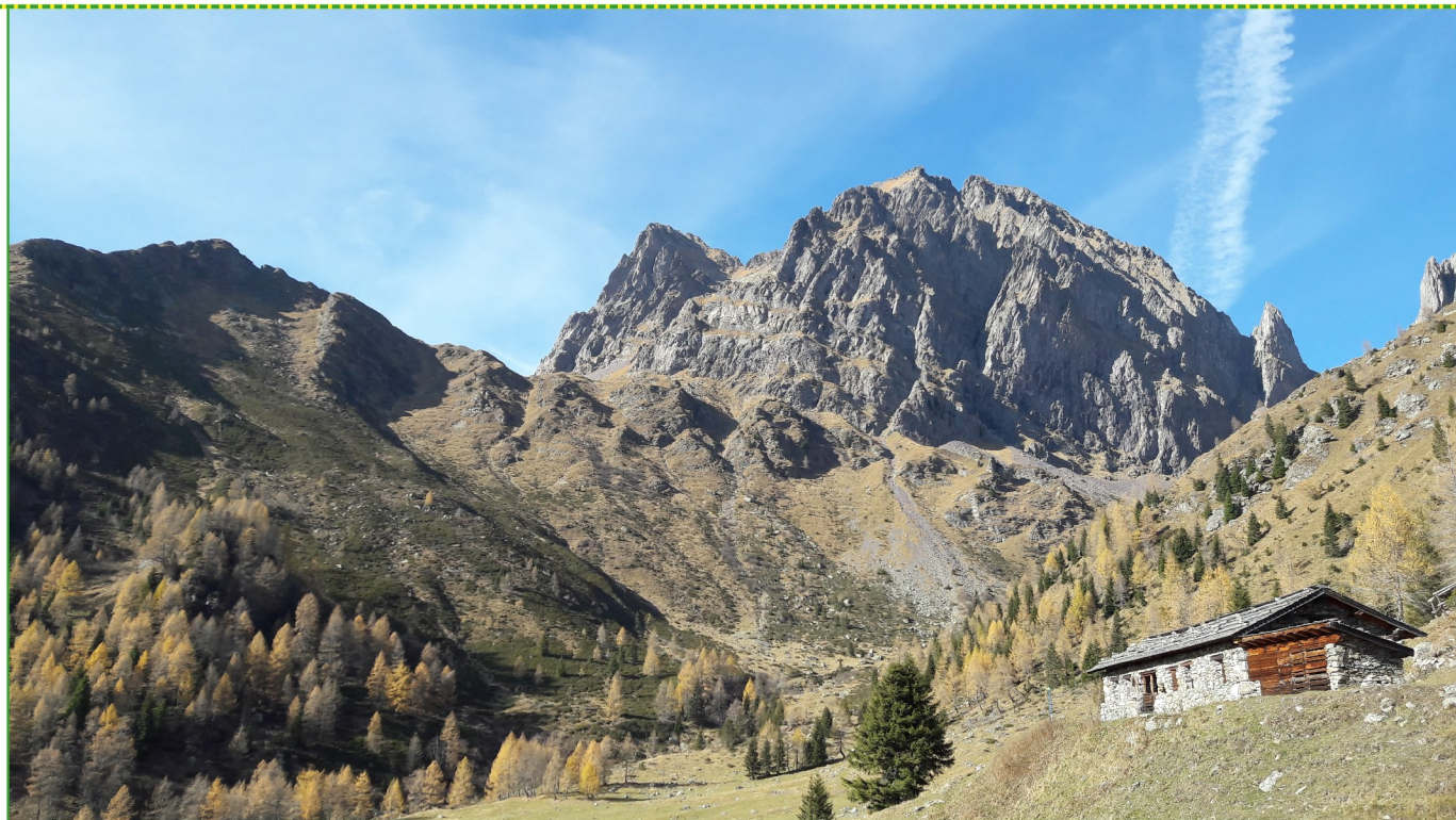
Cima Cece da Malga Miesnota de Sora, punto panoramico "Anello della Montagna"