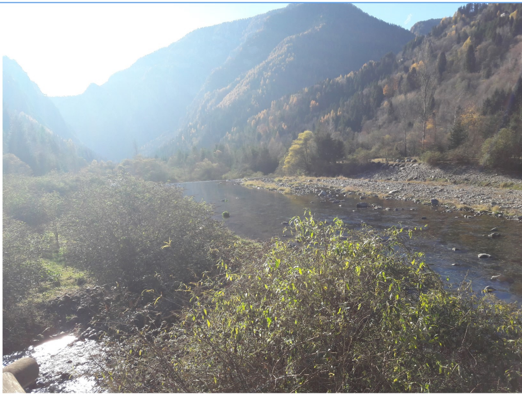
Torrente Vanoi, vista val cortella da pannello informativo n 3, Anello dell'Acqua